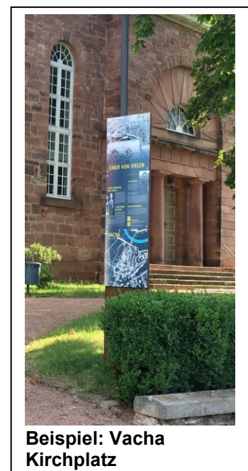
Beispiel: Vacha Kirchplatz

Völkershausen ist aufgrund seiner ereignisreichen Geschichte gerade dazu prädestiniert ein solches Leitsystem zu erhalten. Der Gebirgsschlag vom 13.03.1989 zerstörte nahezu den gesamten Ort und insbesondere die historische Bausubstanz. Das Informationssystem soll u.a. dieses Ereignis aufgreifen und an insgesamt sechs